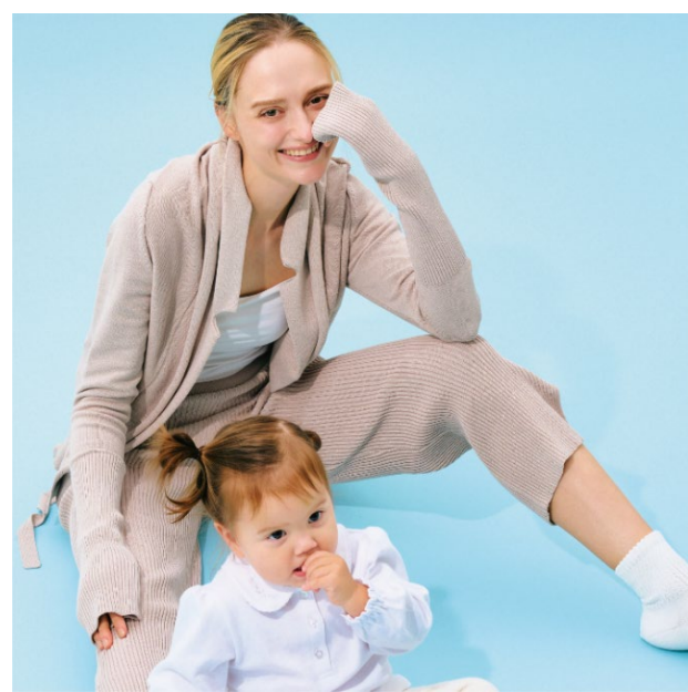
カーディガン ¥29,700 (税込) パンツ ¥23,100 (税込)

名古屋の老舗繊維商社・モリリンが開発した「木糸」は、一般的なモダール繊維に比べてCO2排出量を80%削減したゼロカーボンの素材。その「木糸」を使って原宿の老舗ニットメーカー・ジムが制作したワンマイルニットウェアは、家でくつろげるリラックス感も洗練されたデザインも兼ね備えています。毎日の暮らしにも、旅行のお供にも。