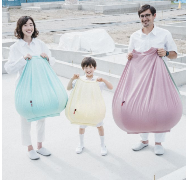
L ¥27,500 (税込) M ¥19,800 (税込) S ¥14,300 (税込)

日本最大の毛織物産地・尾州で制作された生地を用いファッションブランドHISUI伊藤弘子氏ディレクションにより作られた着るビーズクッション。着たまま寝転がることもでき、おうちでのリラックスタイムがより豊かに。中の発泡ビーズは補充可能（有料）です。