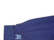
ユニフォーム用にデザインした新ロゴ