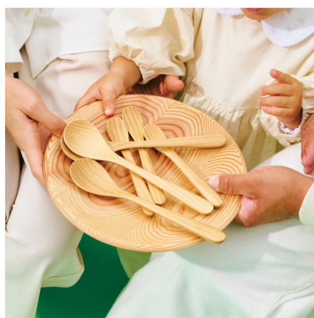
スプーン ¥2,970 (税込) ミニスプーン ¥2,200 (税込) プレート240 ¥6,600 (税込)

名古屋の老舗繊維商社・モリリンが開発した「木糸」は、一般的なモダール繊維に比べてCO2排出量を80%削減したゼロカーボンの素材。その「木糸」を使って原宿の老舗ニットメーカー・ジムが制作したワンマイルニットウェアは、家でくつろげるリラックス感も洗練されたデザインも兼ね備えています。毎日の暮らしにも、旅行のお供にも。