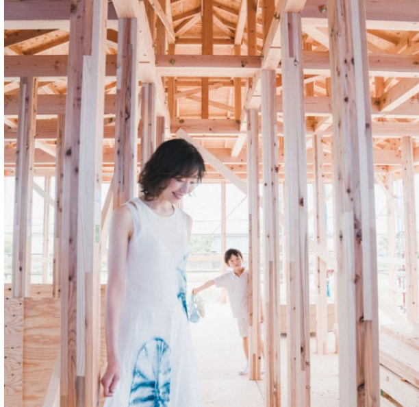
ドレス（藍色・ピンク） ¥42,900 (税込) トップス（藍色・ピンク） ¥35,200 (税込) バッグ ¥27,500 (水色・ピンク・グリーン) (税込)

有松絞りの開祖の流れを汲む竹田嘉兵衛商店の技術指導のもと、ウィメンズウェアブランドODAKHAの小高真理ディレクションにより制作。最新のニット技術によって伝統工芸の美しさが際立ちます。