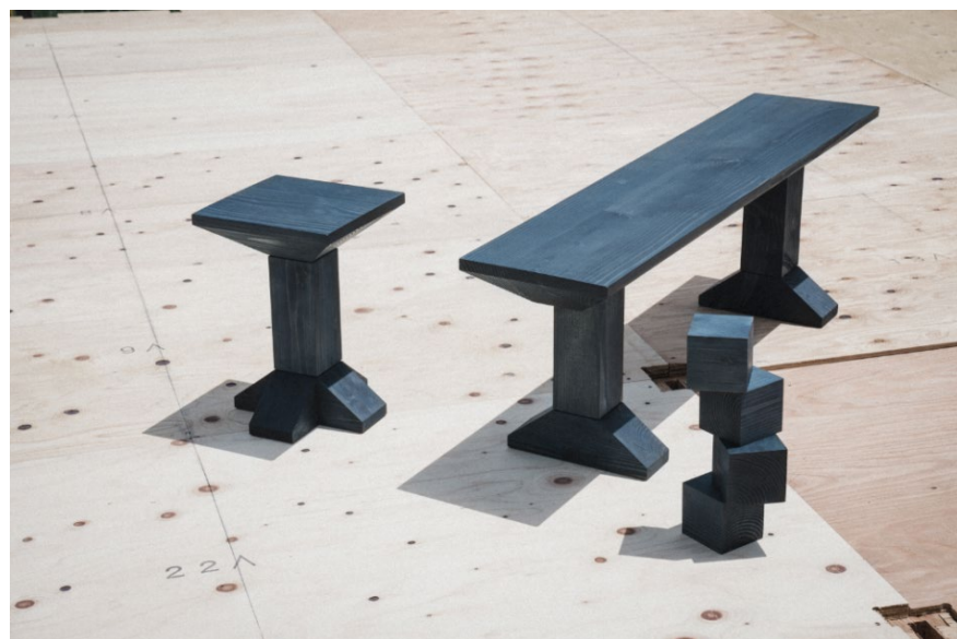
ベンチ ¥165,000 (税込) スツール ¥143,000 (税込) 積み木 ¥16,500 (税込)

「地域事業者」×「デザイナー」をテーマに3つのプロダクトを開発しました。それぞれ「藍染め」「尾州生地」「有松絞り」という後世に残すべき日本の伝統工芸が融合したプロダクトは、地域を元気に、サバーバンライフをより豊かに輝かせます。